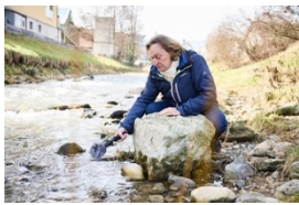
L'artiste Andres Bosshard capture les sons du quotidien.

Les sons du quotidien sont au centre du projet-modèle « Lieux de silence. Lieux d'écoute ». Malgré leur influence sur la façon dont nous percevons l'espace, nous avons souvent à peine conscience de leur existence. L'ouïe permet de partir à la découverte des qualités d'un paysage de façon inédite, mais aussi de les modeler.