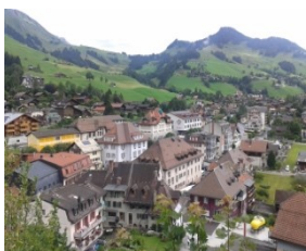
Le paysage comme qualité de site, accessible et perceptible pour tous.

Château-d'Œx (VD), la plus grande commune régionale du canton de Vaud, veut se positionner comme espace d'habitation et destination touristique attrayante pour les personnes âgées, qui forment une part proportionnellement élevée de la population, aussi en comparaison suisse. Dans ce projet-modèle , le paysage et l'activité physique jouent un rôle à différents niveaux.