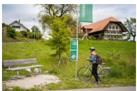
Stations découvertes le long de l'itinéraire cyclable 888

Dans le projet-modèle « Ruban vert », les parties prenantes développent une stratégie de développement intégrale pour la ceinture paysagère unique autour de la ville et de l'agglomération de Berne. Ce faisant, elles concrétisent leur collaboration au travers de projets, à l'image des stations découvertes aménagées cet été le long de l'itinéraire cyclable 888.