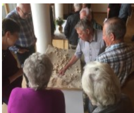
La commune de montagne de Hasliberg développe une maison intergénérationnelle.

L'habitat intergénérationnel était au centre de l'échange d'expérience de l'axe thématique en mars 2021. Contexte rural ou urbain, projet de construction concret ou mesures d'organisation, développement d'un prototype d'appartement : l'éventail des projets-modèles présentés était vaste.