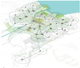
Oasis urbaines : un espace public pour tous, accessible en 5 minutes

Les aspects positifs du paysage et de l'activité physique sur la santé et le bien-être peuvent aussi être exploités dans l'espace urbain. Le projet-modèle d'Yverdon-les-Bains mise sur la détente de proximité et montre que celle-ci ne dépend pas forcément de vastes espaces.