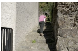
Assurer le service universel c'est aussi des cheminements quotidiens adaptés aux personnes âgées.

La forte migration qui draine les vallées alpines vers les centres urbains a d'importantes conséquences pour la population âgée qui reste sur place : dans les régions périphériques, l'offre de services diminue. Les nouvelles technologies de communication offrent des chances intéressantes à cet égard. La manière dont elles sont intégrées à l'univers (physique) des seniors constitue cependant un facteur central.