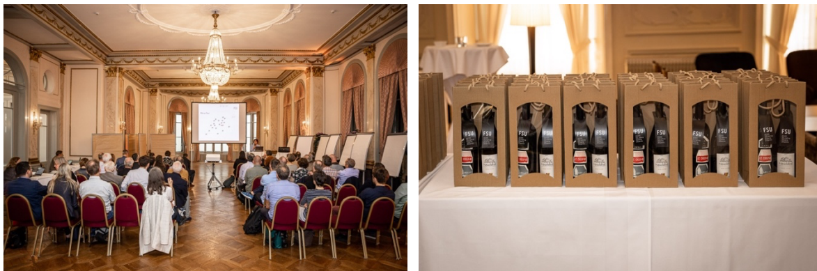
Illustration 2 : Assemblée Générale dans la salle Bringolf. Le vin du jubilé provenait des cantons d'origine de la coprésidence, soit du Tessin et de Neuchâtel.